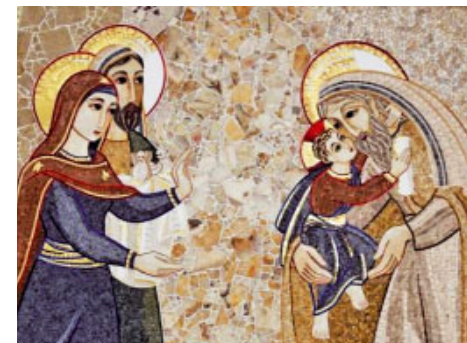
Presentació del Senyor al temple, mosaic de Marko Rupnik

G airebé tothom coneix aquesta festa com la Candelera fent referència a les candeles que portem durant la celebració. Però avui és sobretot la Presentació del Senyor al temple. Jesús com veiem a l'evangeli, és presentat i ofert al Senyor: Els pares de Jesús el portaren a Jerusalem per presentar-lo al Senyor, complint el que prescriu la Llei, que tot noi fill primer sigui consagrat al Senyor. Jesús, també com a home, viurà sempre entregat, consagrat al Pare. I ha vingut al món per a il·luminar totes les nacions tal com diu Simeó: Els meus ulls han vist el Salvador que preparàveu per presentar-lo a tots els pobles; llum que es reveli a les nacions. Jesús és la glòria d'Israel però la seva llum ha d'il·luminar tot el món. També nosaltres hem de ser llum pel món (ho signifiquen les candeles que portem a les mans). La primera lectura parla del missatge que prepari el camí al Senyor: Tot seguit el Senyor que vosaltres busqueu, entrarà al seu temple. La seva missió? Purificarà els descendents de Leví (els sacerdots) i des d'aleshores oferiran al Senyor una oblació digna i les oblacions de Judà i Jerusalem seran agradables al Senyor. El Senyor ve a purificar-nos perquè la nostra vida sigui una ofrena agradable al Pare.